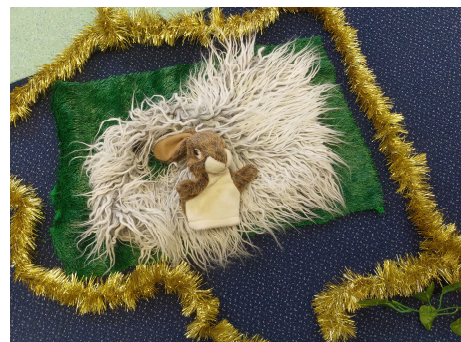
Schutzwall durch Elektrozaun