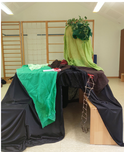
Bühne unterirdisch, für Spieler und Protagonisten

Bis hierher schreibe ich, wenn möglich schon während der Stunde, erkläre den Kindern: „Ich schreibe das schon mal auf, damit ich mir alles gut merken kann.“ Die Kinder finden das meist sehr gut, da sie durch mein Fragen und Wiederholen deutlich sehen und hören, was sie bis zu diesem Zeitpunkt bereits vorbereitet haben und dass ich gut aufpasse und verstehen möchte. Vielleicht verändern sie auch noch einmal etwas oder überlegen, was oder wen sie spielen wollen.