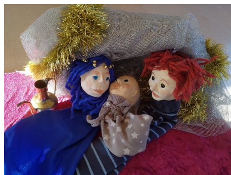
Das Baby im Mittelpunkt